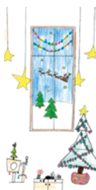
H4421 „Kuschelige Weihnachtszeit“ Klappkarte DIN lang/1 € Menge: _____