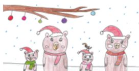
H6121 „Die Bärenfamilie im Winter“ Klappkarte DIN lang/1 € Menge: _____