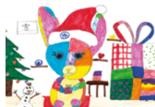
A421 P „Rainbow Candy und das riesige Geschenk“ Postkarte DIN A6/1 € Menge: _____