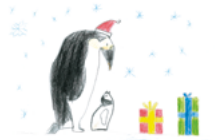
G2021 „Pinguine feiern Weihnachten“ Klappkarte DIN A6/1 € Menge: _____