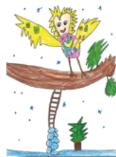
H6021 „Wintereule“ Klappkarte DIN A6/1 € Menge: _____