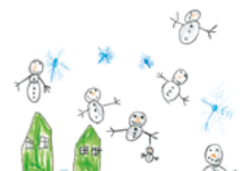
H5521 „Der Regen der Schneemänner“ Klappkarte DIN A6/1 € Menge: _____