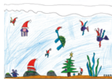
E221 „Weihnachten im Aquarium“ Klappkarte DIN A6/1 € Menge: _____