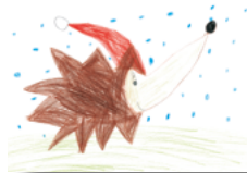
I2821 „Der Schneeeigel“ Klappkarte DIN A6/1 € Menge: _____