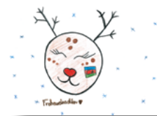
J2221 P „Rentierchen“ Postkarte DIN A6/1 € Menge: _____