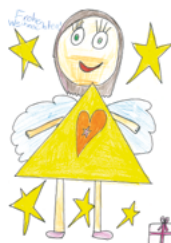
H1621 P „Der Winterengel“ Postkarte DIN A6/1 € Menge: _____