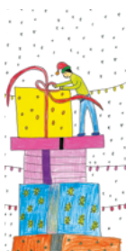
H1521 „Der Weihnachtswichtel“ Klappkarte DIN lang/1 € Menge: _____