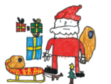
B721 „Der Weihnachtsmann und die Geschenke“ Klappkarte DIN A6/1 € Menge: _____